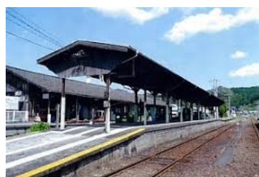
天竜浜名湖鉄道 気賀駅